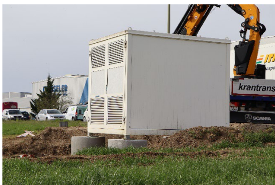
Transformatorenstation auf dem ESAF-Gelände

Primeo Energie ist Königspartnerin für den Strom. Das Unternehmen beliefert den Grossanlass exklusiv mit hundertprozentig regionalem Sonnenstrom. Damit die elektrische Energie auf das Festareal gelangt, wurden in den vergangenen Monaten bereits kilometerweise Kabel auf dem Gelände in Pratteln verlegt. Mitte April 2022 stellten Netzelektriker sechs temporäre Transformatorenstationen auf, die den Strom auf ESAF-Betriebsspannung bringen. Die Energiepartnerschaft vertieft die enge Zusammenarbeit zwischen dem ESAF Pratteln im Baselbiet und Primeo Energie weiter.